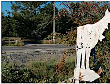
En face chèvre blanche ET CENTRE EQUESTRE

110 chemin de la CIGOGNE - Route de Sauve - 30820 CAVEIRAC